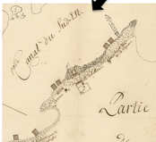
Extrait du Plan du port et de la colonie de l'île de St.Pierre (1680-1700) montrant anse à Bertrand (Galica)