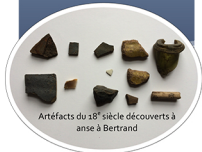
Artéfacts du 18 e siècle découverts à anse à Bertrand

Le potentiel du site a été révélé au cours d'une prospection pédestre réalisée en août 2016, ainsi que par l'étude des cartes anciennes qui ont permis de comprendre l'occupation du site depuis le 17 e siècle. En mai 2017, des carottages ont mené à l'identification d'une couche d'occupation datant du 18 e siècle. Ces découvertes ont motivé la mise en place d'un premier chantier de fouille au cours de l'été 2017. Cet été les fouilles se poursuivent dans la perspective de documenter les établissements qui se sont succédé à anse à Bertrand au cours des siècles.